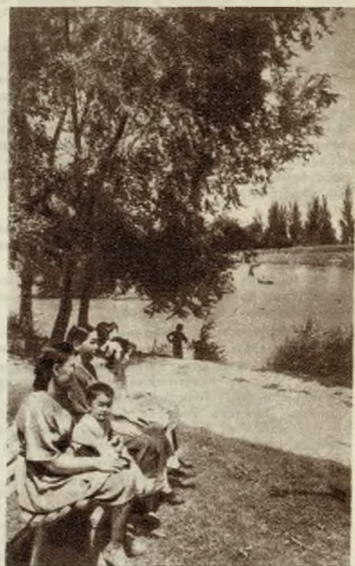
В Алмаатинском парке культуры и отдыха имени Горького.

тало не больше 365 человек. Основным источником существования жителей Верного оставалось сельское хозяйство.