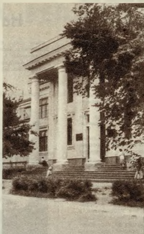
Казахский государственный университет имени С. М. Кирова.

Верный стал уездным, а затем и областным городом. В нем появились водочный и пивоваренный заводы, несколько мастерских по переработке кожи, шерсти и табака. Всего в городской промышленности рабо-